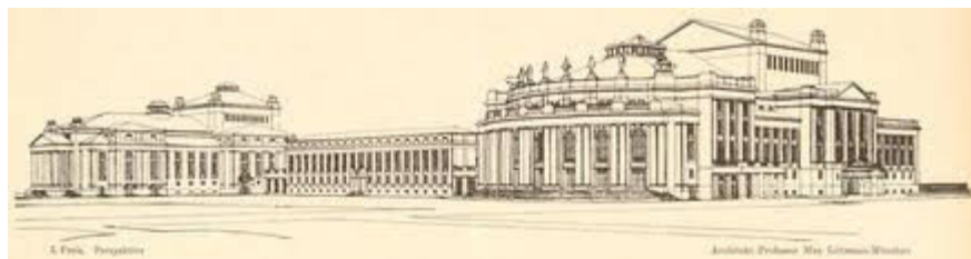
Das neue Stuttgarter Hoftheater; Entwurf von Max Littmann (1912)

Zum Begründer der "Stuttgarter Schule" wird Theodor Fischer, der 1901-08 an der Technischen Hochschule lehrt. Das nach seinen Plänen errichtete Kunstgebäude setzt seine Forderungen nach einem regional eingebetteten, handwerklich präzisen und nach Materialgerechtigkeit strebenden Historismus programmatisch um. Die Versachlichung und Abstraktion der zitierten Stilformen weist bereits auf die klare Formensprache der Moderne voraus. 1911 geht der Fischer-Schüler Paul Bonatz als Sieger aus dem Wettbewerb zum Stuttgarter Hauptbahnhof hervor. Dessen Bau beginnt 1913 nach einem zukunftsweisenden Entwurf, der bei der Vollendung 1927 aber bereits veraltet scheint. "Links" durch die Architekten des Dessauer Bauhauses und der Stuttgarter Weißenhofsiedlung überholt,